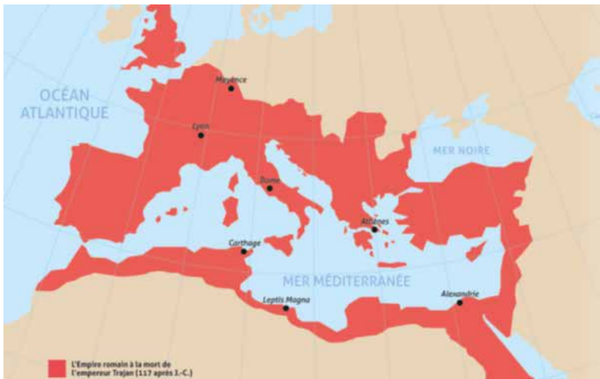
Carte 2 - SHS/MER/HISTOIRE_LE_9_th4_pp_46_59 p. 46