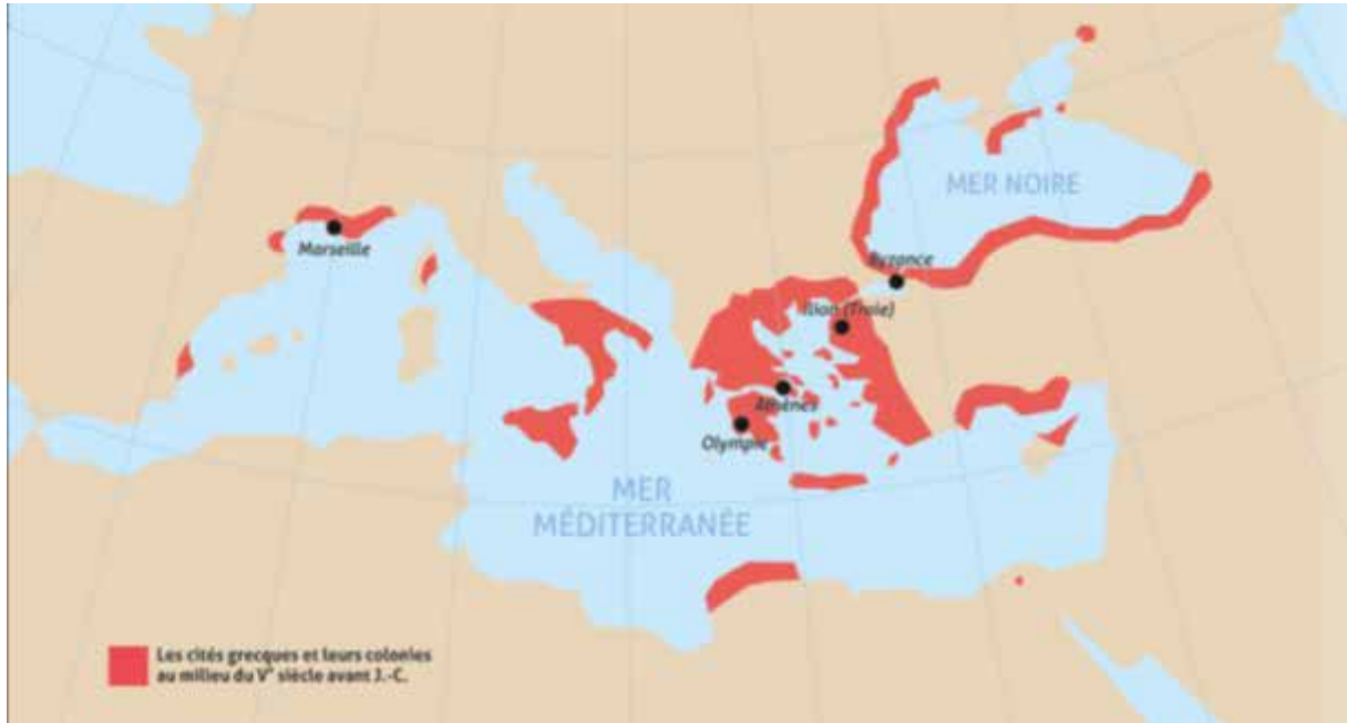
Carte 1 - SHS/MER/HISTOIRE_LE_9_th1_pp_6_19 p. 6

Prends connaissance des cartes suivantes